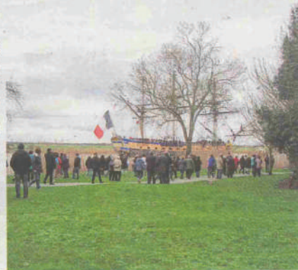
Le départ de l'Hermione s'est déroulé sans encombre

attrapé le même virus car sur les 15 professionnels qui seront à bord, tous sauf deux membres d'équipages ont été gabiers volontaires.