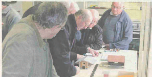
La gare de Saint-Agnant, actuellement en construction, viendra compléter la maquette de la ligne Cabariot-Le Chapus.

Les membres du Rail club océan reconstituent l'épopée du chemin de fer.