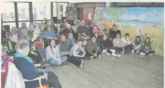
Cette inauguration "en famille" a eu lieu avant le vernissage officiel ultérieur avec l'ARS.

Une œuvre artistique rapproche les jeunes et les résidents de l'EHPAD Dubois-Meynardie.