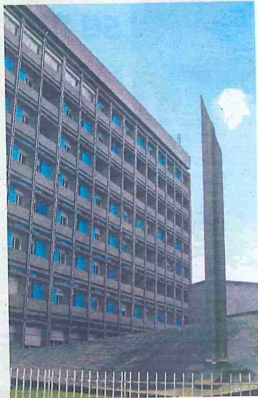
Dans le futur projet, rien ne dit que tout l'hôpital sera conservé et la tour notamment.