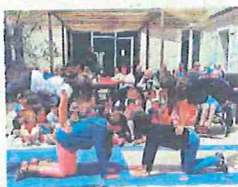
Les élèves de Saint-Joseph aux Jardins d'Iroise. CPER

KERMESSE Les élèves de l'école Saint-Joseph sont venus répéter leur kermesse de fin d'année à la maison de retraite Les Jardins d'Iroise de Rochefort. L'occasion pour petits et plus âgés d'échanger autour d'un pique-nique et de quelques parties de jeux en bois.