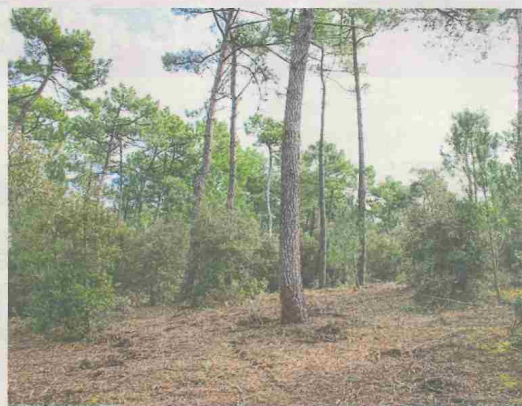
Les nouveaux arbres plantés représentent une superficie de 40 hectares.