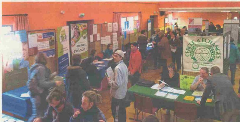
Lors de la première édition du forum à Matha en 2012.

Le 22 novembre, le Département organise le 7 e forum des emplois saisonniers viticoles. Plus d'une centaine d'emplois sont à pourvoir.