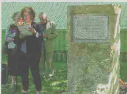
La stèle érigée à la mémoire des neuf fusillés.

COMMÉMORATION Hier en fin d'après-midi, la journée nationale de la Résistance a été célébrée à la stèle du Polygone de la Marine, à proximité du lieu où 9 Résistants ont été fusillés par les Allemands durant la Seconde Guerre mondiale. 75 ans après la première réunion du Conseil national de